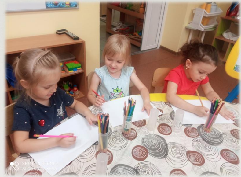
Аппликация «Мы дизайнеры»